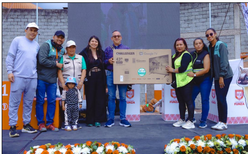
Ilustración 30. Premiación barrio Villa Pola

Los barrios con mayor cantidad de material recolectado fueron Villa Paola (582,3 kg), Nuevo México (133 kg) y La Chaguya (105 kg), quienes fueron reconocidos durante la ceremonia de premiación realizada el 4 de octubre en la Villa Olímpica, en el marco de la celebración del día de los animales. Este reconocimiento destacó el trabajo colaborativo, la organización comunitaria y el impacto positivo generado por la estrategia.