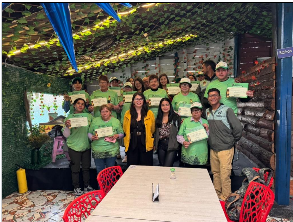
Ilustración 43. Entrega de certificados de participación en el programa Voces por el Gualí.