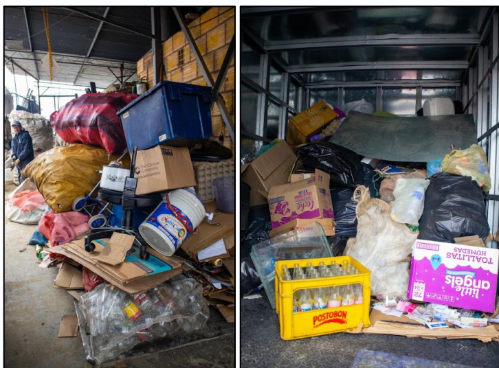
Ilustración 28 y 29. Acopio de material

Los barrios con mayor cantidad de material recolectado fueron Villa Paola (582,3 kg), Nuevo México (133 kg) y La Chaguya (105 kg), quienes fueron reconocidos durante la ceremonia de premiación realizada el 4 de octubre en la Villa Olímpica, en el marco de la celebración del día de los animales. Este reconocimiento destacó el trabajo colaborativo, la organización comunitaria y el impacto positivo generado por la estrategia.