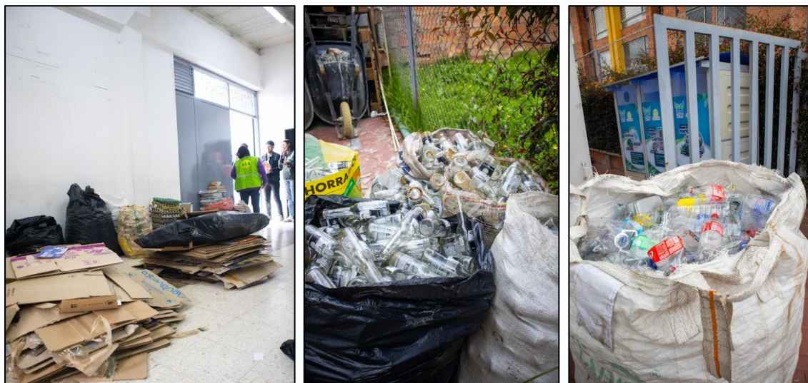
Ilustración 19, 20 y 21. Material aprovechable, reciclatón a tu barrio.

Durante la jornada, se realizaron recolecciones, pesajes y clasificación del material aprovechable, en compañía de personal de la Secretaría de Ambiente y Bienestar Animal y de los recicladores participantes, quienes recibieron reconocimientos simbólicos por su labor.