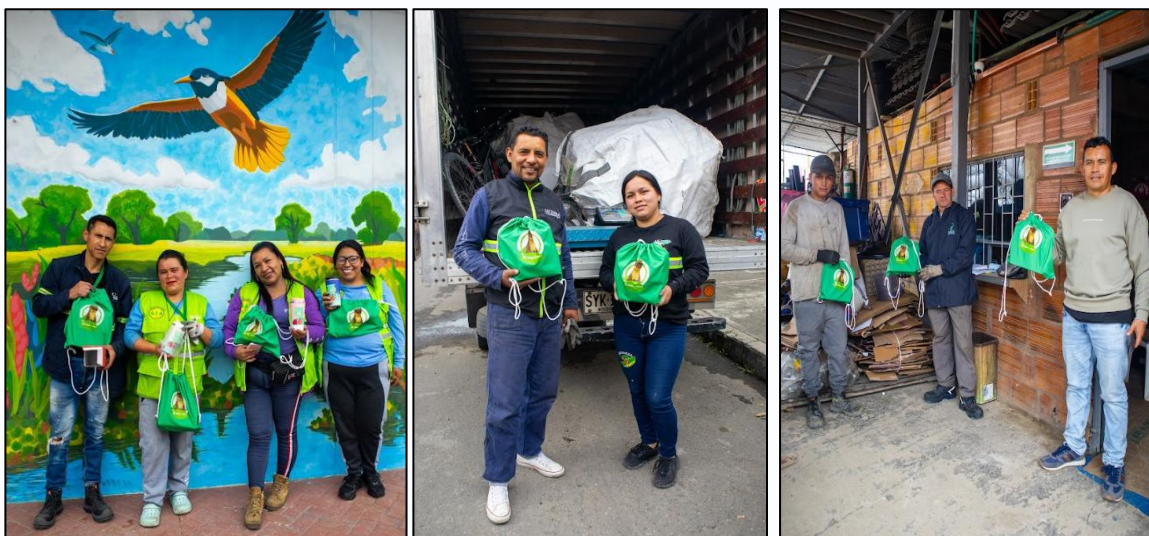
Ilustración 22, 23 y 24. Reconocimiento a los recicladores de las organizaciones que participaron en la jornada

En total, se lograron acopiar 1.059,1 kilogramos de residuos aprovechables, distribuidos entre materiales como papel, cartón, plástico, vidrio y metales, reflejando el compromiso de la comunidad con la sostenibilidad ambiental.