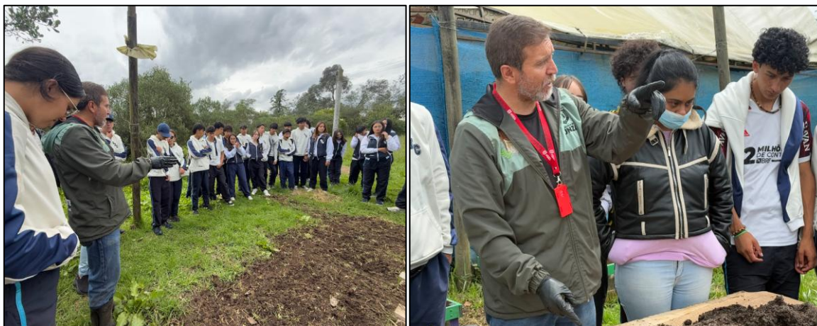
Ilustración 37 y 38. Charla sobre el proceso de propagación de especies arbóreas.

germinación y cuidado de especies arbóreas y ornamentales que apoyan las estrategias de reforestación y embellecimiento urbano.