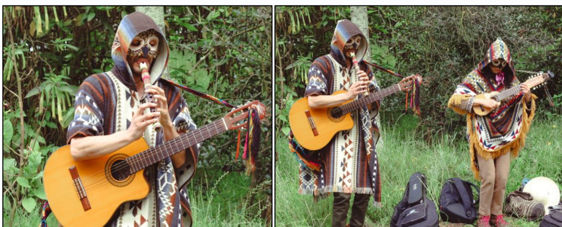
Ilustración 46 y 47. Interpretación musical.

Durante la jornada, se contó con la presentación de un grupo musical, que amenizó el encuentro y promovió un ambiente de integración y disfrute colectivo. Además, los asistentes participaron en una actividad simbólica, en la que se presentaron diferentes especies de fauna que habitan el humedal, como inspiración para escribir compromisos personales hacia la protección de este espacio.