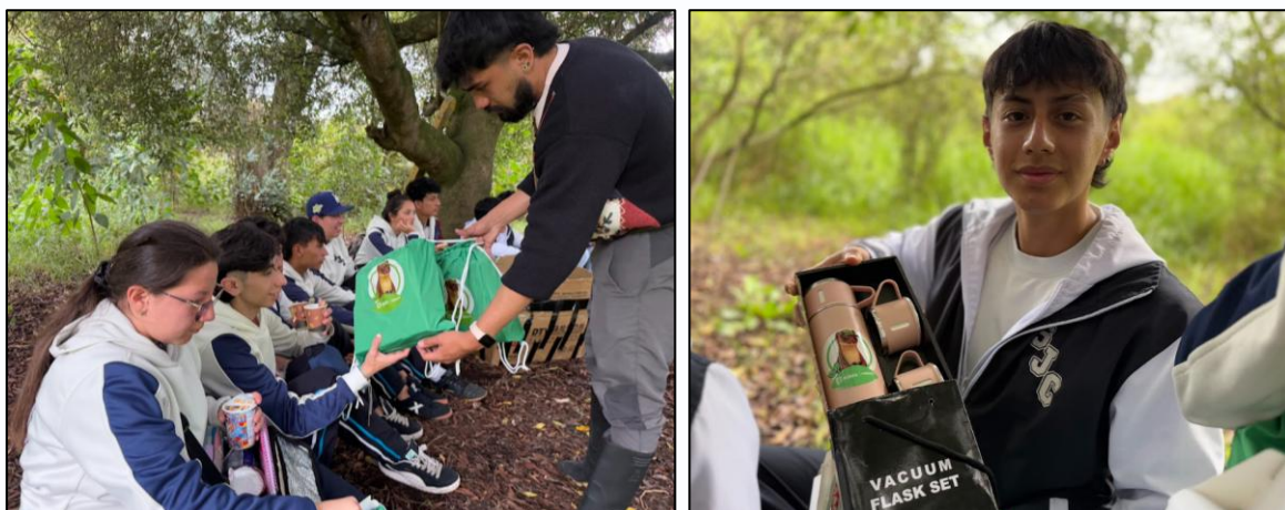
Ilustración 41 y 42. Reconocimiento simbólico a estudiantes por su participación en la jornada ambiental.