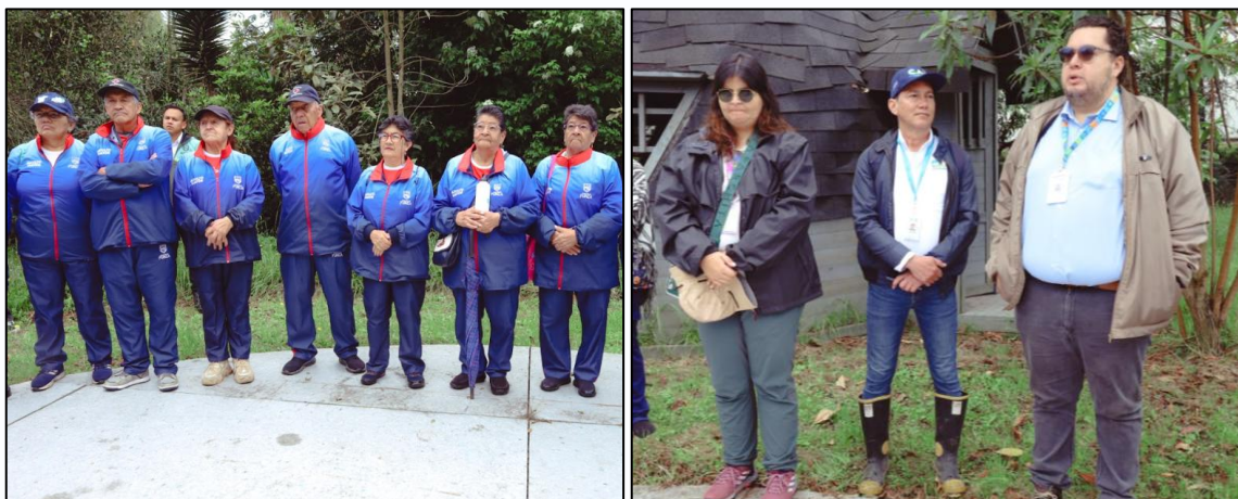
Ilustración 44 y 45. Charla educativa sobre la importancia ecológica del Humedal Gualí.

una charla educativa sobre la relevancia de este ecosistema estratégico y su rol en la regulación hídrica y la biodiversidad local.