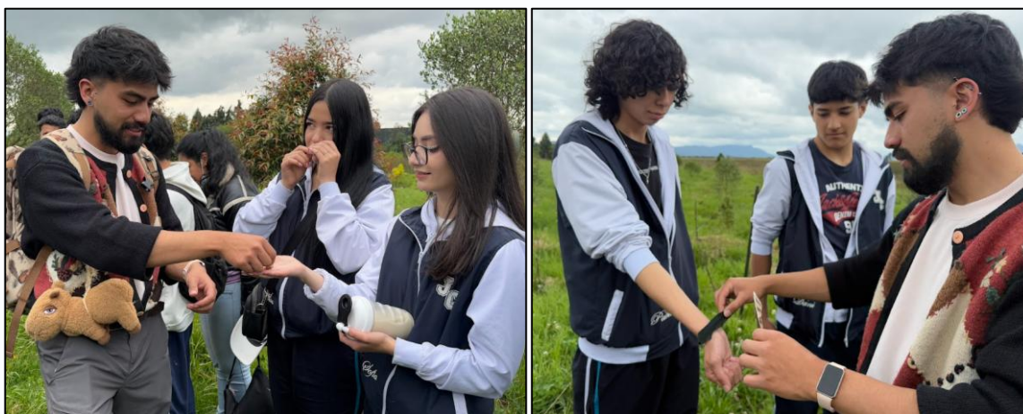
Ilustración 35 y 36. Proceso sensorial de identificación de especies de flora y fauna del humedal.

Al finalizar el recorrido, el equipo técnico de la Secretaría ofreció una charla educativa sobre restauración vegetal y propagación de especies nativas, complementada con una visita guiada al vivero municipal, espacio destinado a la