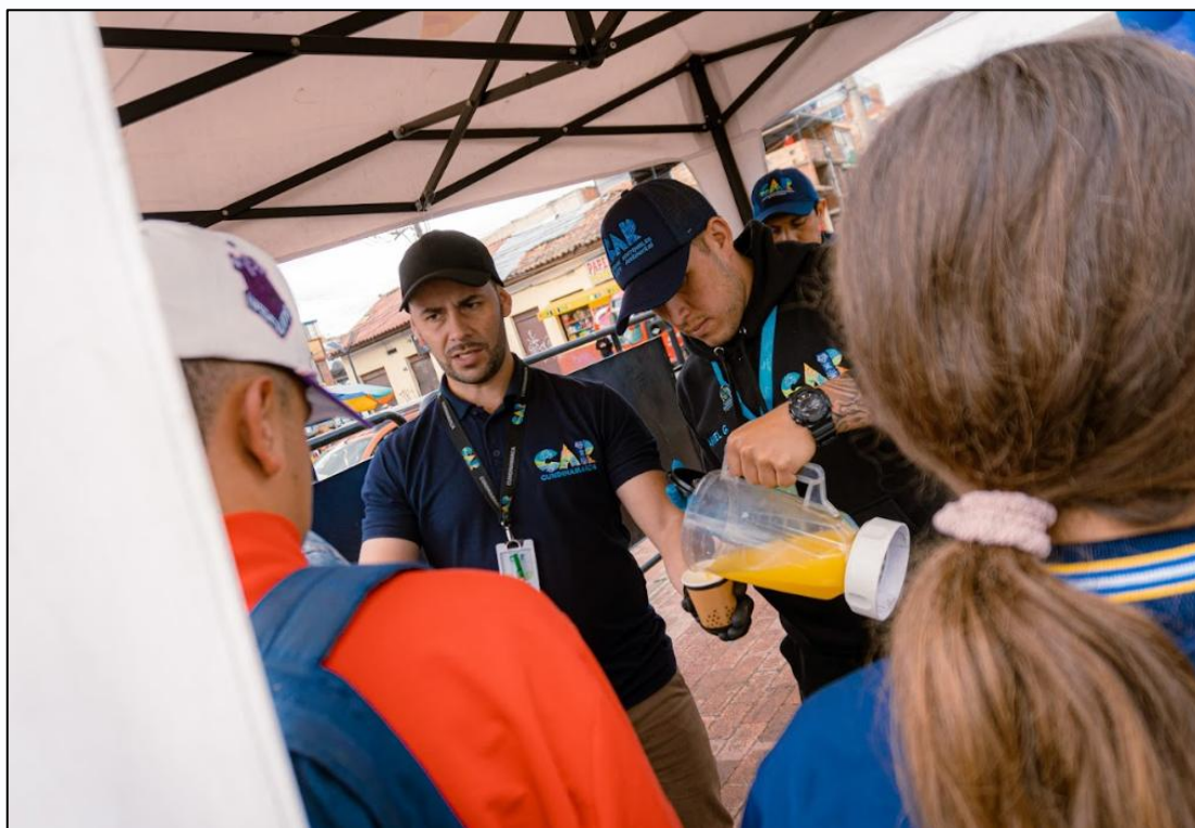
Ilustración 17. Taller energía renovable y movilidad sostenible.