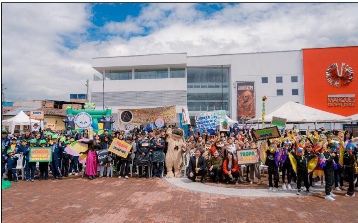
Ilustración 13. Foto grupal apertura Semana de Ambiente y Bienestar Animal.

Posteriormente, se dio apertura a la Feria Educativa de Ambiente y Bienestar Animal, un espacio interactivo y formativo liderado por la Secretaría de Ambiente y Bienestar Animal, con el apoyo de la Corporación Autónoma Regional de Cundinamarca CAR.