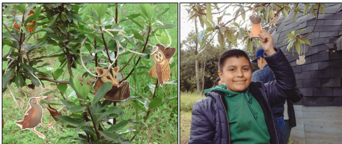
Ilustración 52 y 53. Acto simbólico.

Finalmente, la jornada culminó con la entrega de obsequios y refrigerios a los participantes, como muestra de agradecimiento por su participación y compromiso ambiental. Este cierre representó un momento de conexión, aprendizaje y sensibilización, reafirmando el mensaje central de la semana: el ambiente se protege con acciones colectivas y sostenibles desde el territorio.