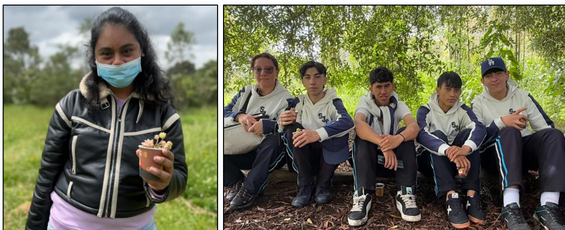
Ilustración 39 y 40. Reconocimiento simbólico a estudiantes por su participación en la jornada ambiental.

Esta experiencia fortaleció el vínculo entre la comunidad educativa y el ecosistema, promoviendo el aprendizaje vivencial, la apropiación del territorio y el reconocimiento del Humedal Gualí como un aula viva para la educación ambiental y la conservación en Funza.