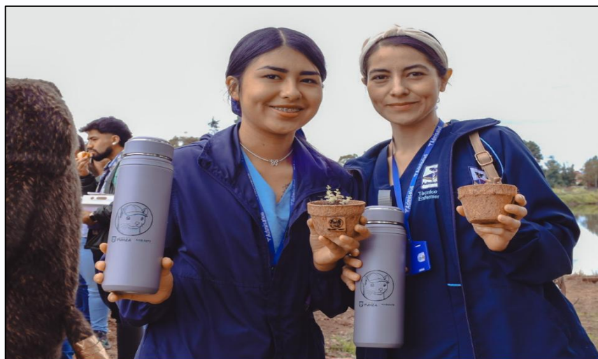
Ilustración 54. Entrega de obsequios.

Finalmente, la jornada culminó con la entrega de obsequios y refrigerios a los participantes, como muestra de agradecimiento por su participación y compromiso ambiental. Este cierre representó un momento de conexión, aprendizaje y sensibilización, reafirmando el mensaje central de la semana: el ambiente se protege con acciones colectivas y sostenibles desde el territorio.