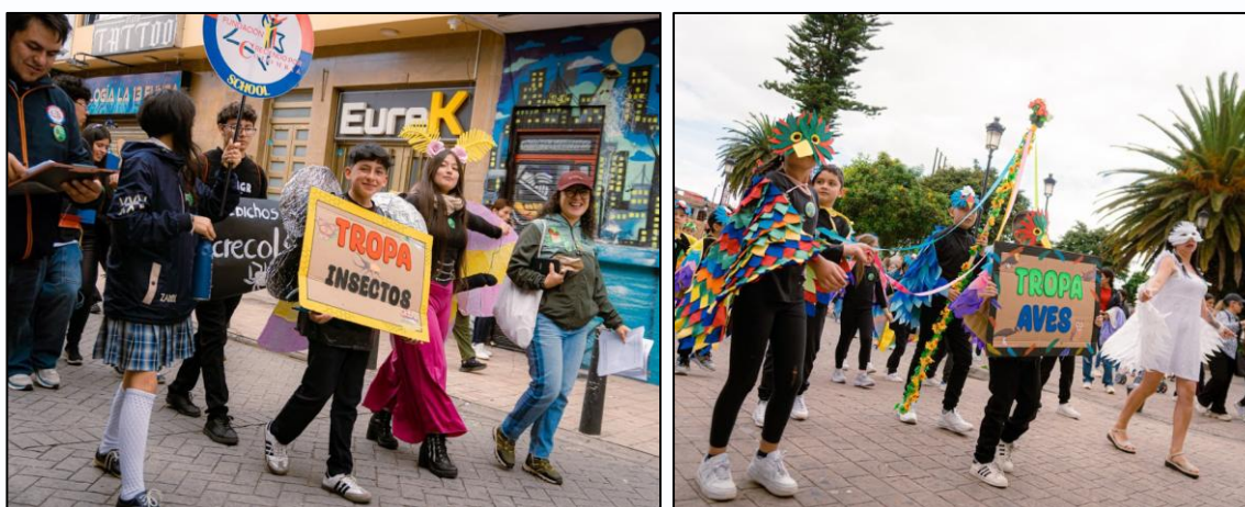
Ilustración 3 y 4. Tropa insectos y tropa aves - comparsa de apertura de la Semana de Ambiente y Bienestar Animal.