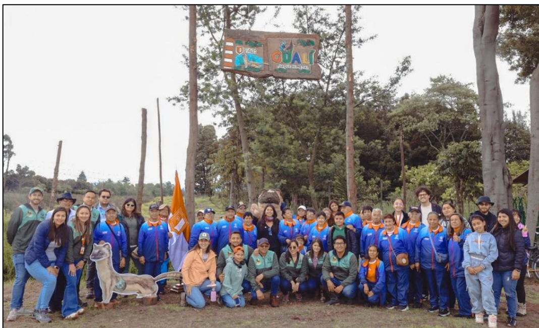
Ilustración 55. Cierre semana de ambiente y bienestar animal.

A continuación, se describe la cantidad de participantes por evento: