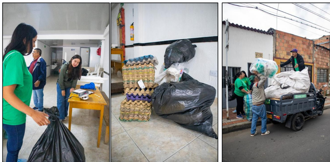
Ilustración 25, 26 y 27. Jornada de recolección de residuos en la reciclaron a tu barrio.

En total, se lograron acopiar 1.059,1 kilogramos de residuos aprovechables, distribuidos entre materiales como papel, cartón, plástico, vidrio y metales, reflejando el compromiso de la comunidad con la sostenibilidad ambiental.