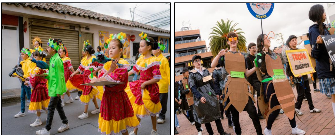
Ilustración 5 y 6. Desfile tropa anfibios y tropa insectos.