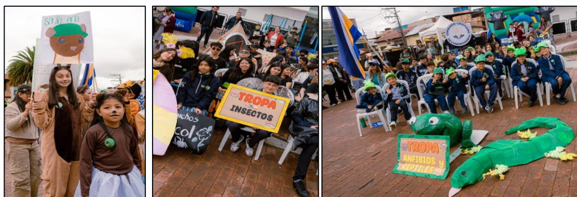
Ilustración 7, 8 y 9. Tropa Awa, tropa insectos y tropa anfibios y reptiles.

El acto protocolario incluyó palabras de apertura por parte de las autoridades locales, quienes resaltaron la importancia de fortalecer la cultura ambiental como eje de desarrollo sostenible.