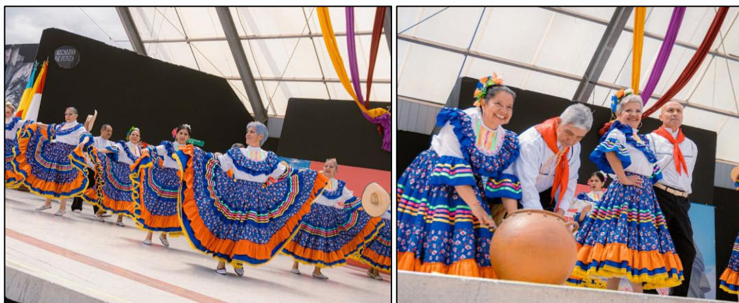
Ilustración 12. Acto cultural grupo adulto mayor Centro Cultural Bacata

A continuación, se presentó un número artístico de danza a cargo del grupo de formación del Centro Cultural Bacatá, conformado por adultos mayores funzanos que, a través del ritmo y la coreografía, transmitieron un mensaje de energía, unión y compromiso con el ambiente y los animales