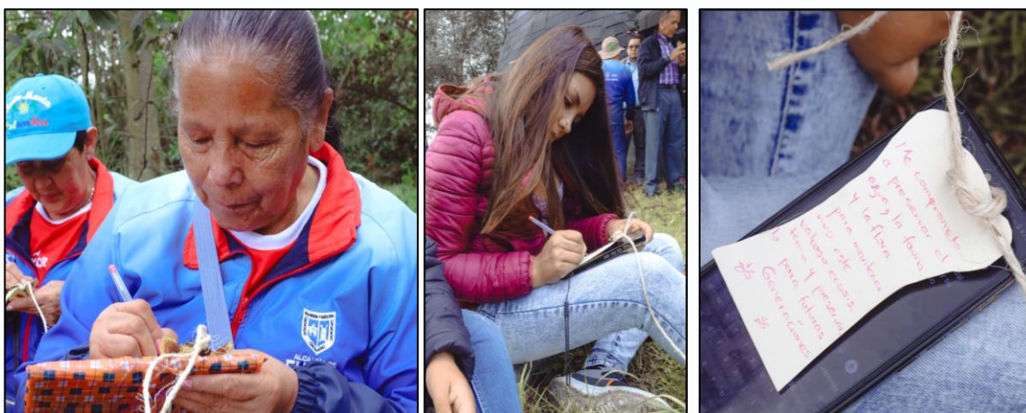
Ilustración 49, 50 y 51. Firma de compromisos.