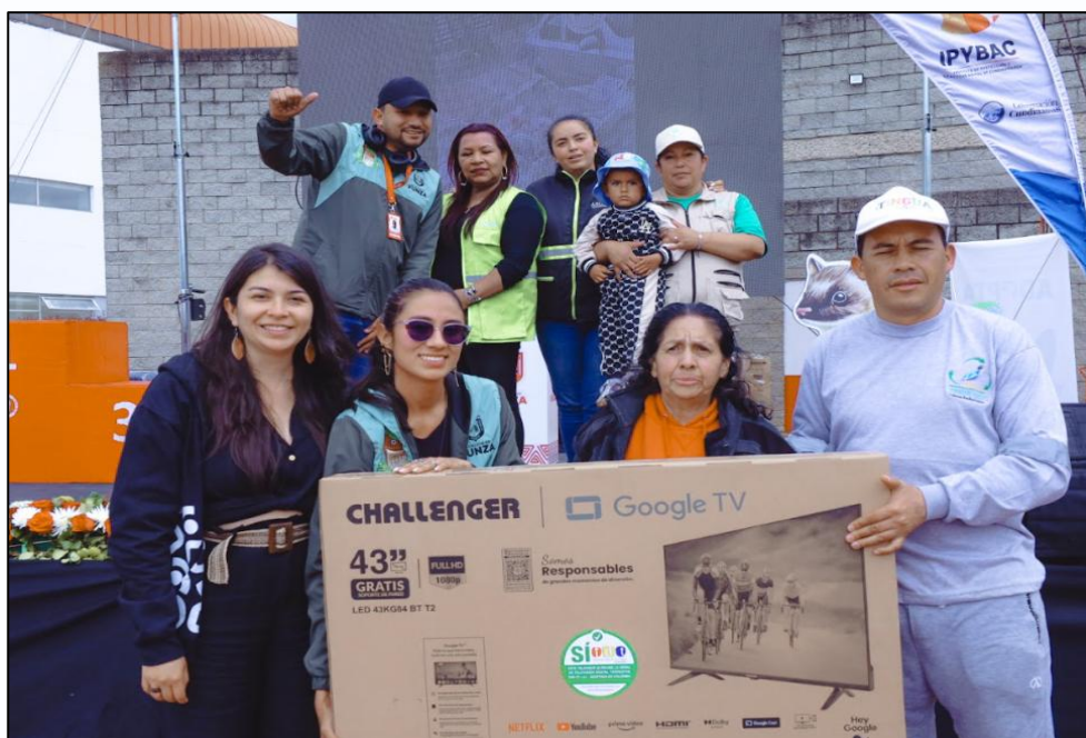
Ilustración 32. Premiación barrio La Chaguya.