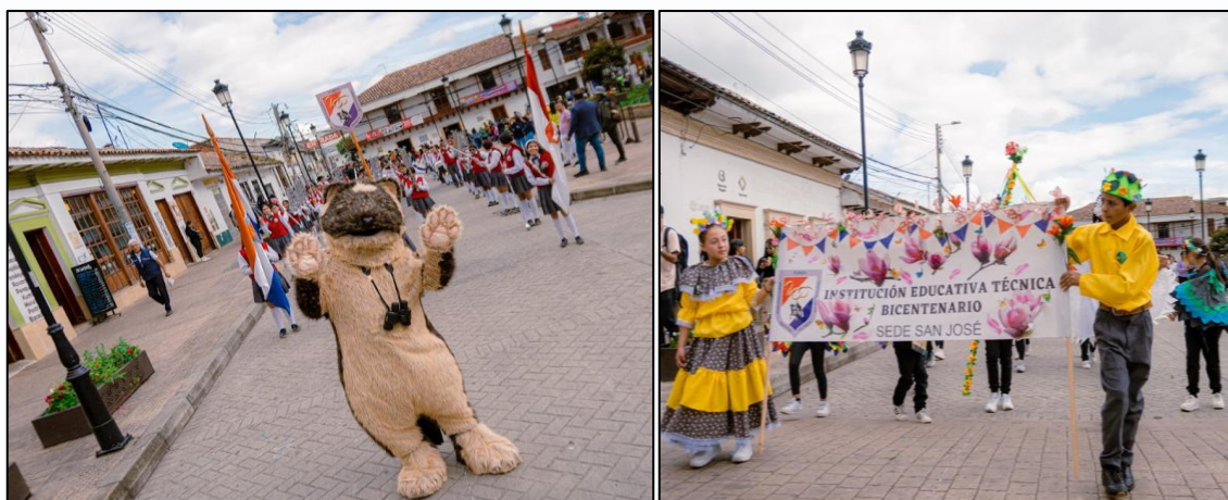
Ilustración 1 y 2. Comparsa de apertura de la Semana de Ambiente y Bienestar Animal.

Cada institución representó una categoría de fauna, mamíferos, aves, reptiles y anfibios, insectos, animales domésticos y la figura de AWA, guardiana del humedal Gualí, símbolo de la biodiversidad y del espíritu protector del territorio funzano.