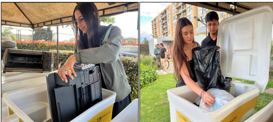
Ilustración 33 y 34. Reciclación Postconsumo.

De manera complementaria, la Reciclación Postconsumo realizada del 1 al 3 de octubre, incentivó la disposición responsable de residuos especiales como pilas, luminarias, medicamentos vencidos y aparatos eléctricos o electrónicos, consolidándose como una acción articulada al Plan de Gestión Integral de Residuos Sólidos (PGIRS).