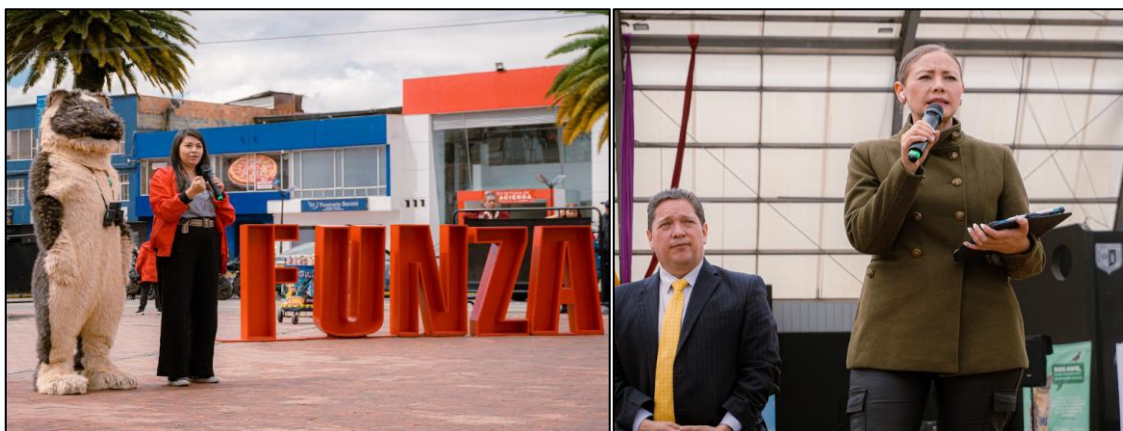
Ilustración 11. Intervenciones autoridades

A continuación, se presentó un número artístico de danza a cargo del grupo de formación del Centro Cultural Bacatá, conformado por adultos mayores funzanos que, a través del ritmo y la coreografía, transmitieron un mensaje de energía, unión y compromiso con el ambiente y los animales