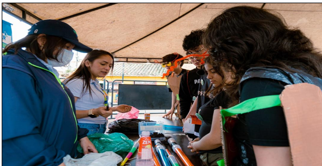
Ilustración 16. Taller entornos sostenibles.