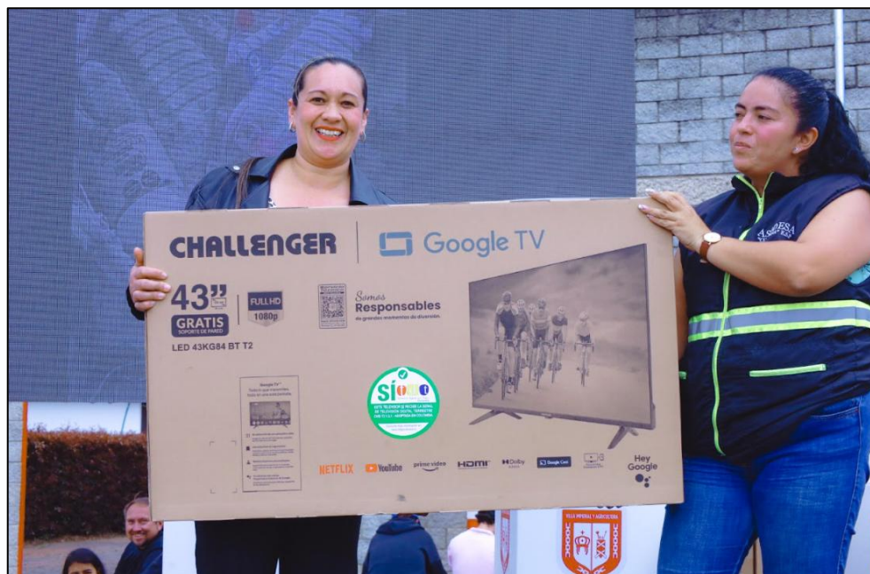
Ilustración 31. Premiación barrio Nuevo México.