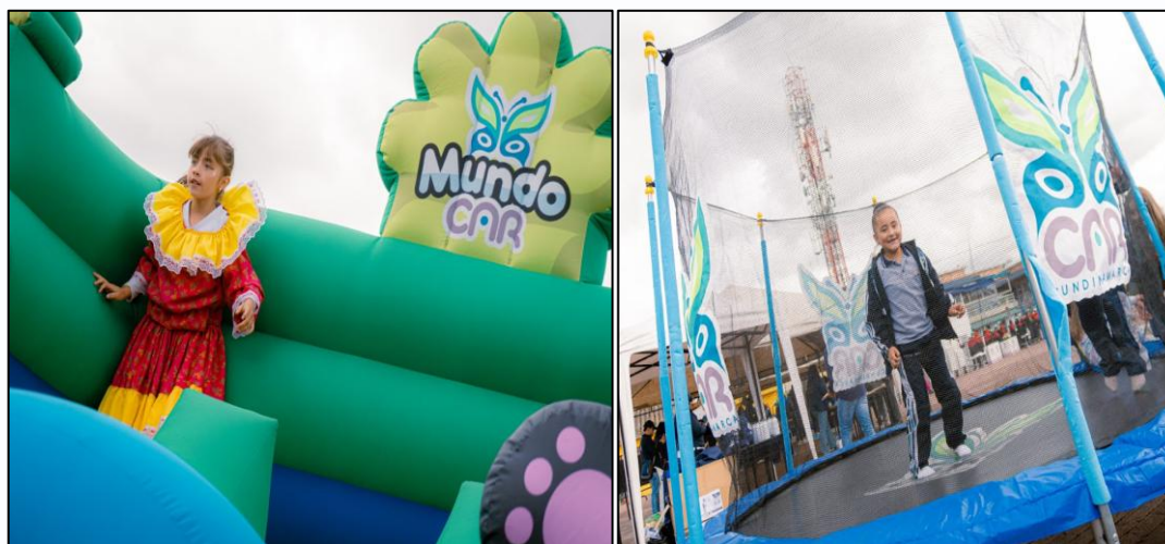
Ilustración 18. Espacio recreativo saltarín y trampolín.

La actividad concluyó hacia el mediodía con un mensaje de agradecimiento a las instituciones participantes y a los aliados estratégicos por su aporte en la construcción de una comunidad más consciente, solidaria y ambientalmente responsable.