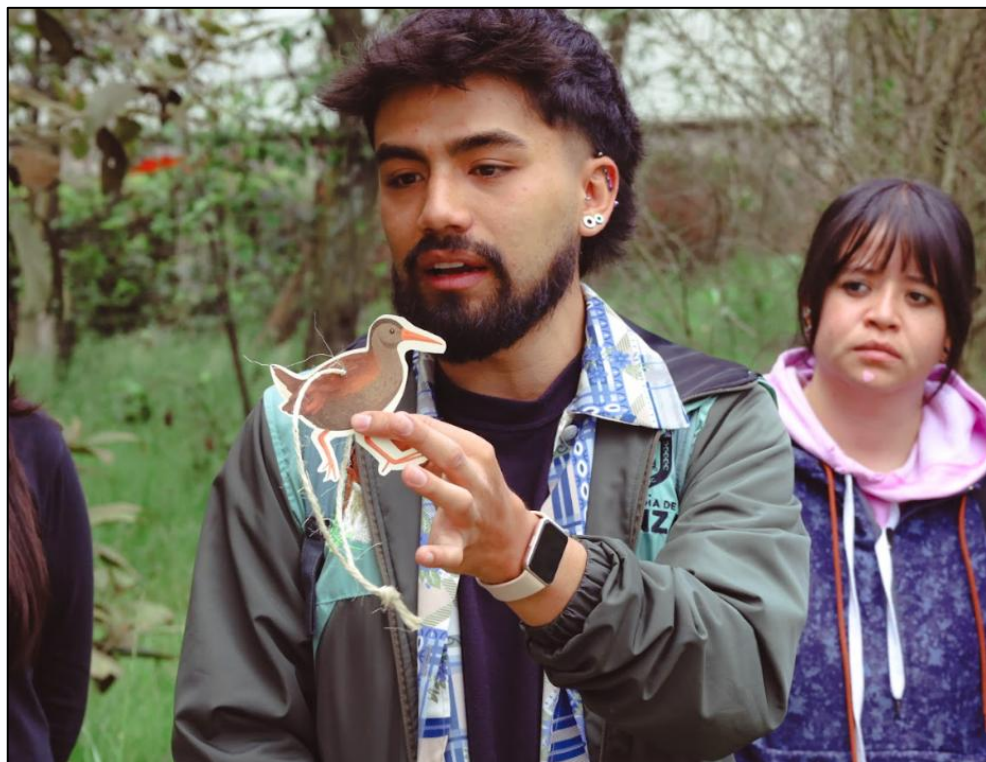
Ilustración 48. Explicación de la dinámica de la firma de compromisos.

Cada compromiso fue colgado en un árbol representativo, simbolizando la unión de la comunidad funzana con la naturaleza y su compromiso con el cuidado del agua, la fauna y los ecosistemas del municipio.